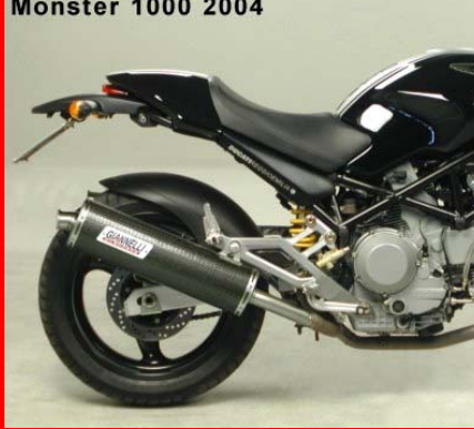
Monster 1000 2004