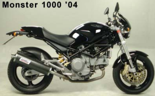
Monster 1000 '04