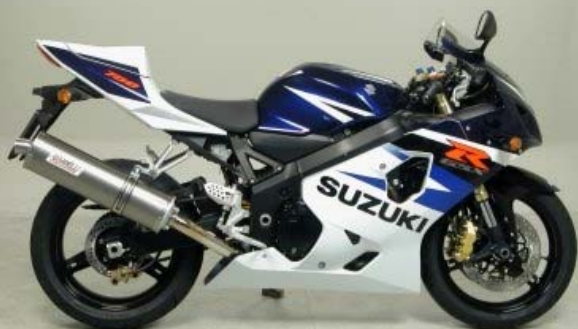
GSX R 750 2004