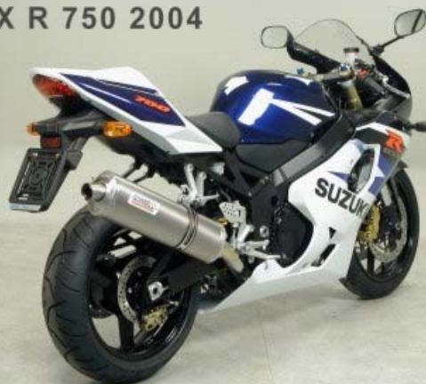
GSX R 750 2004