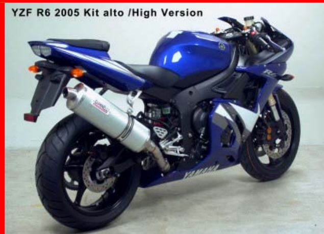
YZF R6 2005 Kit alto /High Version