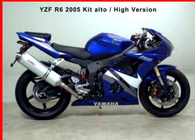
YZF R6 2005 Kit alto / High Version