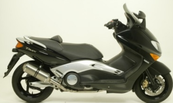
Terminale corto / short silencer