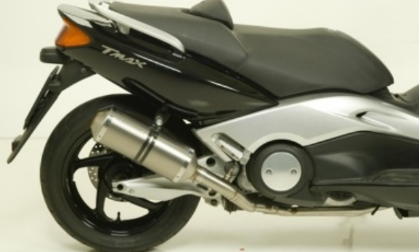
Terminale corto / short silencer